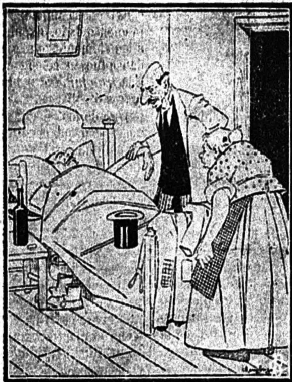
Para que sea la amargura Menos honda del lector, Esta horrenda desventura La ofrece en caricatura De "La Verdad" el director.